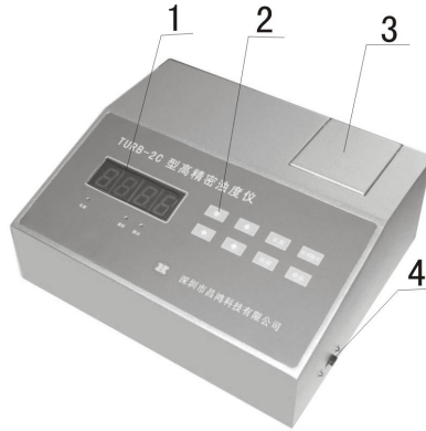
图一 前面板示意图